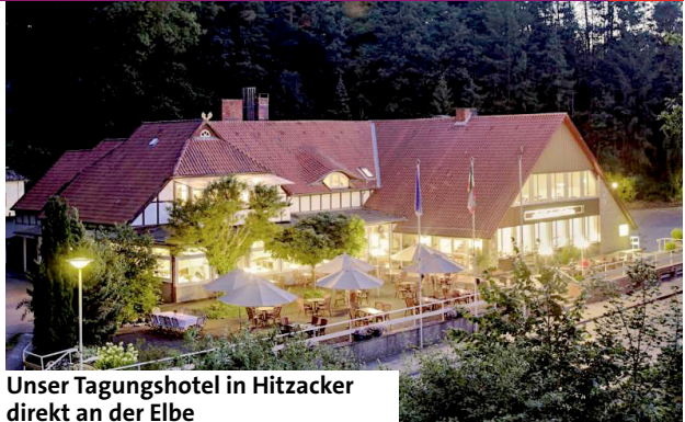
Unser Tagungshotel in Hitzacker direkt an der Elbe